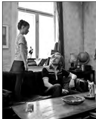
Ich reise allein / Jeg reiser alene

Für etwas Vorgeschmack der Trailer: http://www.kinozeit.de/filme/trailer/ich-reise-allein Eintrittskarten gibt es nur an der Abendkasse ab 19.00 Uhr zum Preis von 5 Euro für Erwachsene und 4 Euro für Schüler, Studenten, Präsenzdienste und Zivildienstleistende mit den entsprechenden Ausweisen.