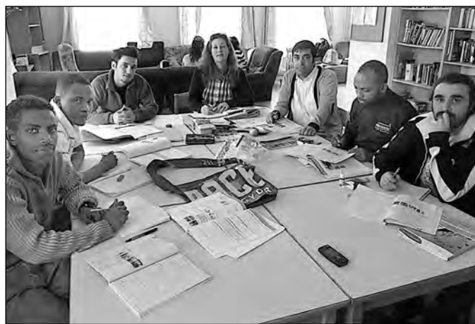
„Grenzenlos Solidarität“ hilft Asylwerbern im ÖJAB-Heim Greifenstein beim Deutschlernen