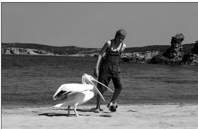
Ein griechischer Sommer