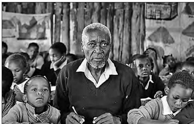
Der älteste Schüler der Welt

Ein wunderschöner Film, der unter die Haut geht.