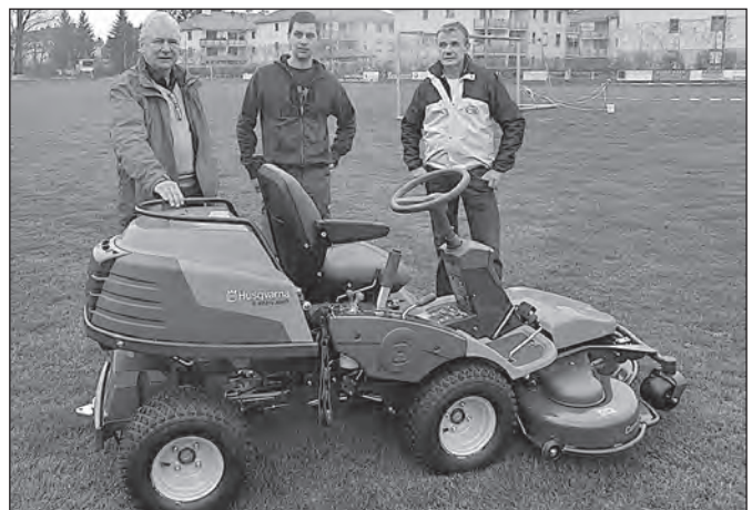
Ein neuer Rasenmäher für den SV St. Andrä-Wördern wurde von der Gemeinde zur Verfügung gestellt.