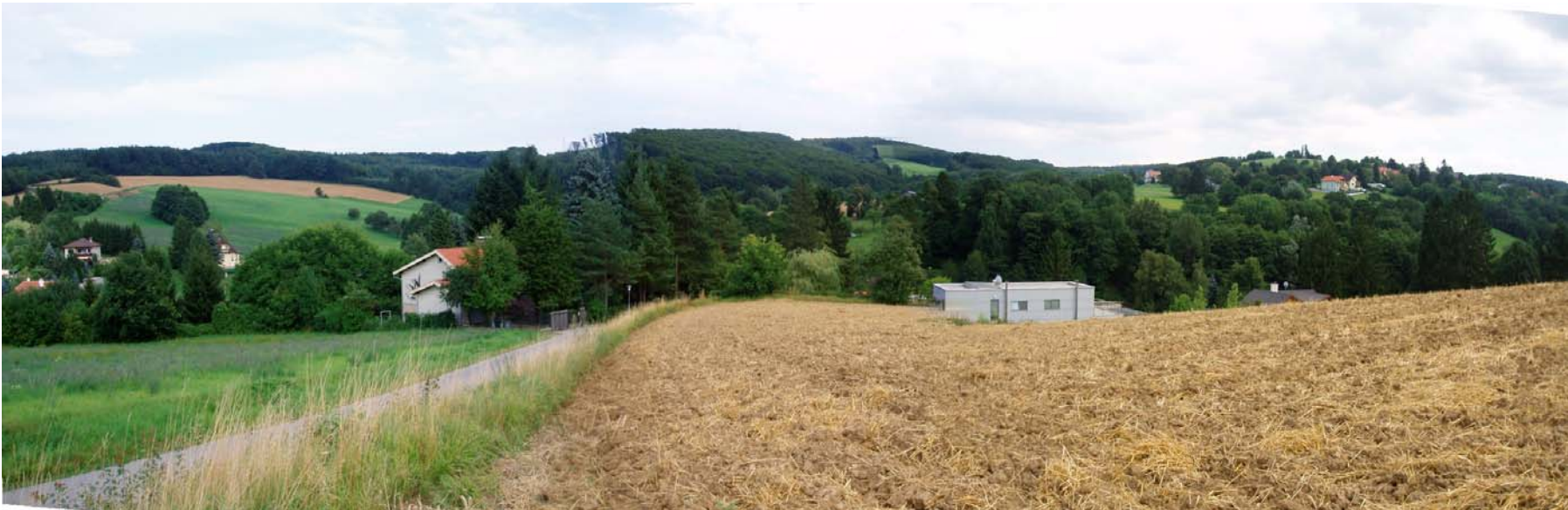
Bild 2: Bauland I (Umwidmungsbereich liegt nördlich [=links] des Feldweges, derzeit mit Luzerne bebaut; Einsehbarkeit von umliegenden Hangbereichen)