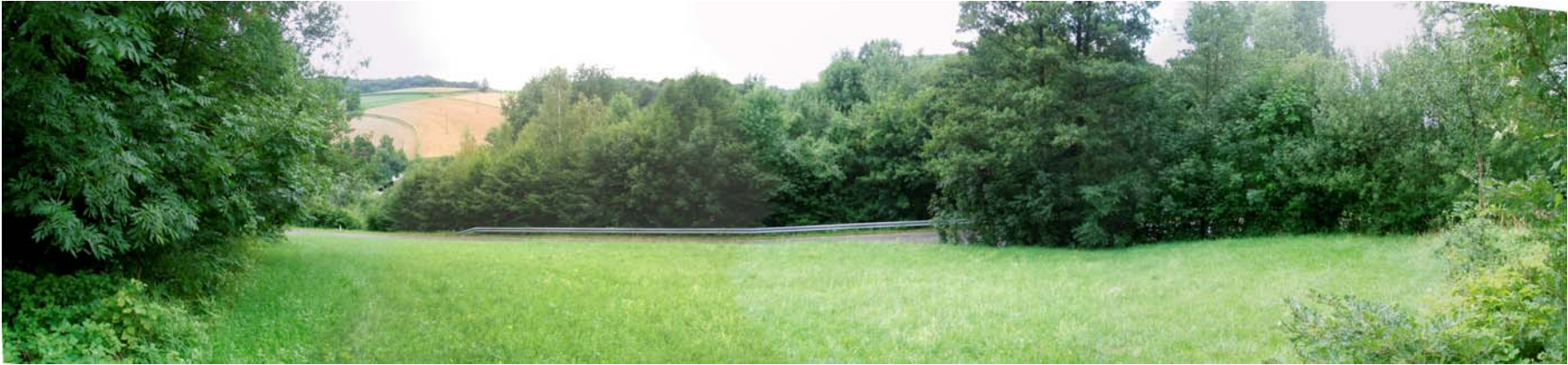
Bild 1: Rückwidmungsbereich (kaum einsehbar; Nutzung als Mähwiese, im Norden und Süden von Gehölzreihen begrenzt)